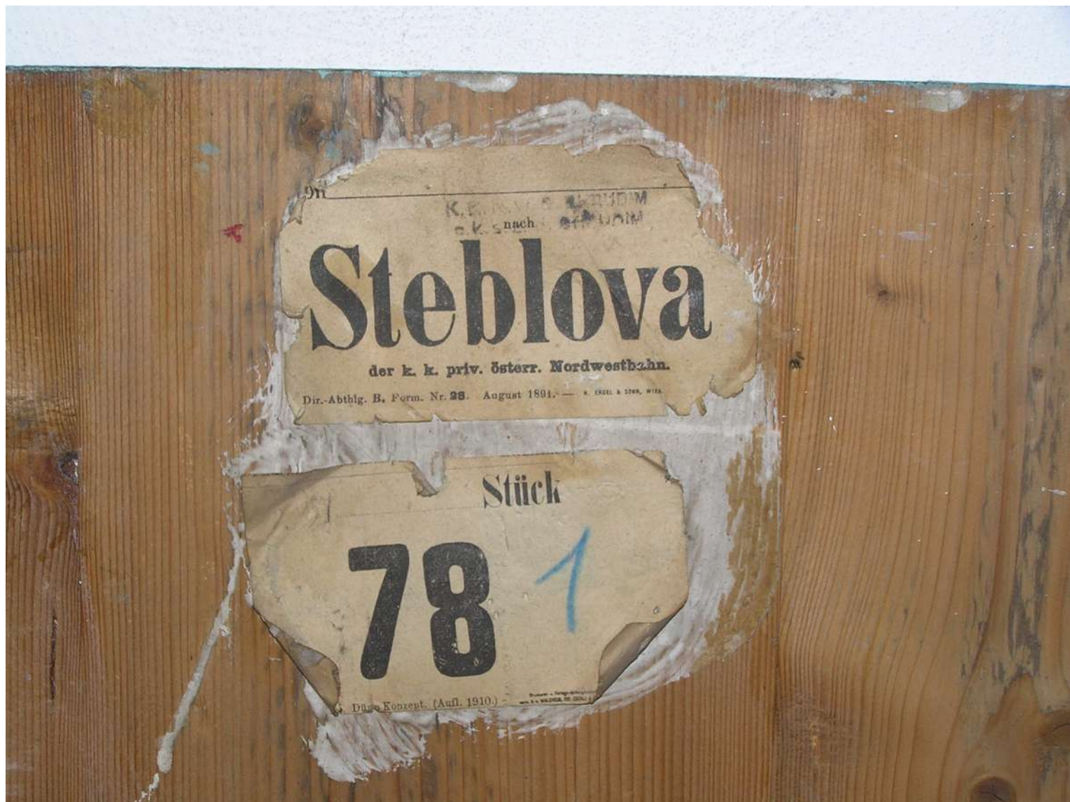
Doklad na částech betlému že knám dorazil drahou 28. Augusta 1891.