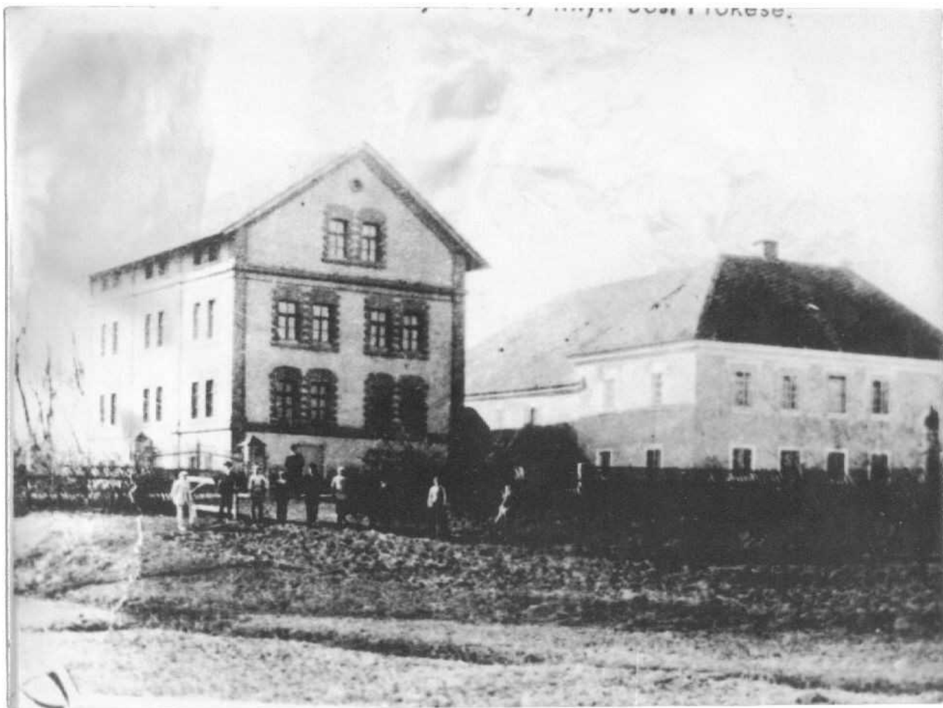
Ždánický mlýn vpravo zadní část ještě před přístavbou schází dvě patra.