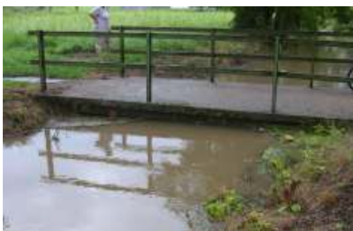
Velká voda z 28.7.2012

Technika ukon íla svou práci t sn p ed mostkem u obecního parku. Celé koryto bylo odbahn no, rákos ar zné náletové