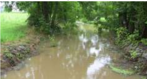
Povode ze dne 28.7. 2012 - ert vka

Obecní rozpo et je v tuto chvíli stabilizovaný. Všechny závazky obec platí v termínech splatnosti a na obecním ú tu nám z stává rezerva na vybudování II. etapy chodník . Další akcí je vým na oken a dve í v . p. 34 (obecní hospoda, obecní sál, služby). Tuto akci dokon íme v m síci íjnu.