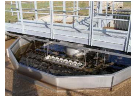
Pohled natechnologii OV

Na podn t místního oznamovatele provedla eská inspekce životního prost edí kontrolu naší OV. Po provedené kontrole vynesla následující záv r: Na základ výsledk místního